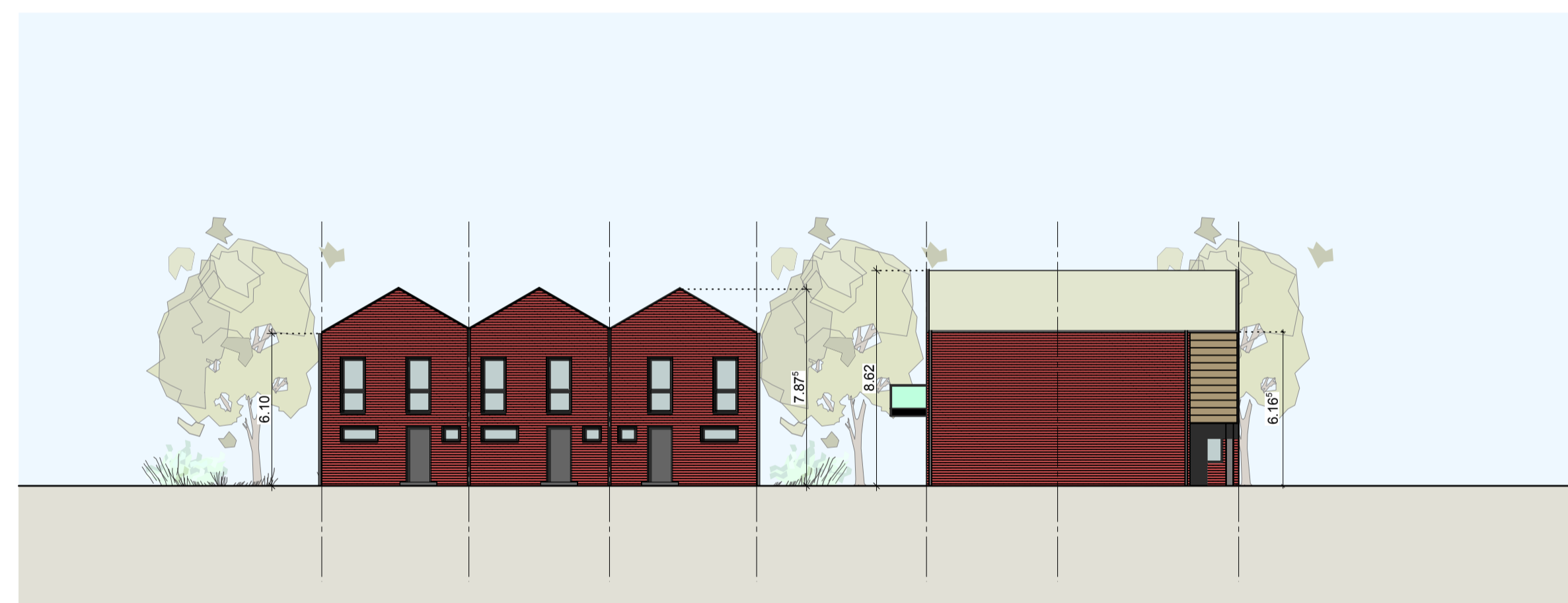
OSTANSICHT HAUS 16 + 18