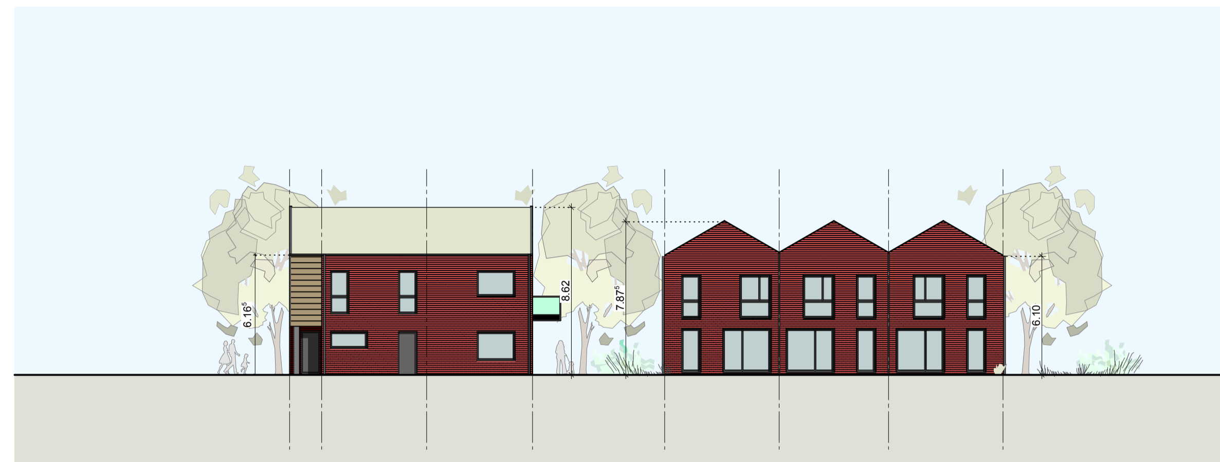
WESTANSICHT HAUS 14 + 16