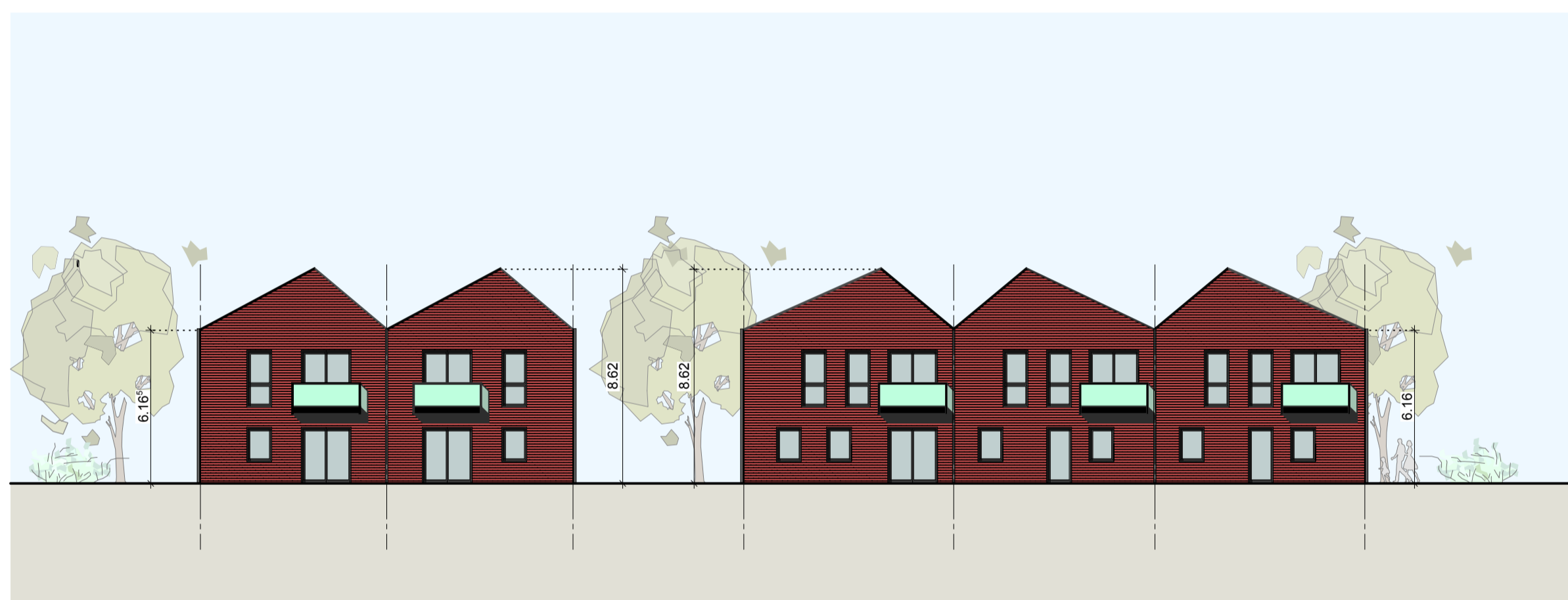
SÜDANSICHT HAUS 14 + 18