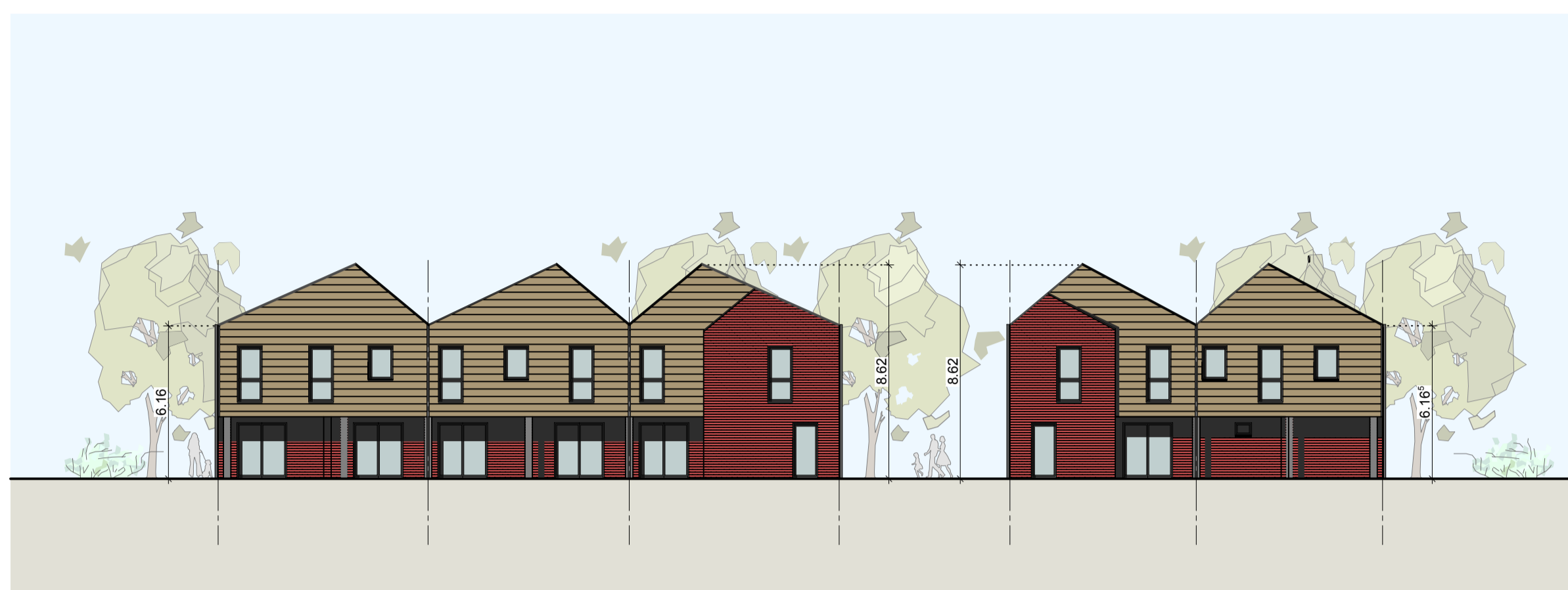
NORDANSICHT HAUS 18 + 14