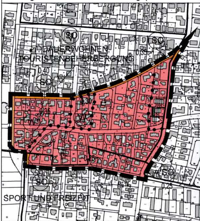
Bislang wirksame Flächennutzungsplan