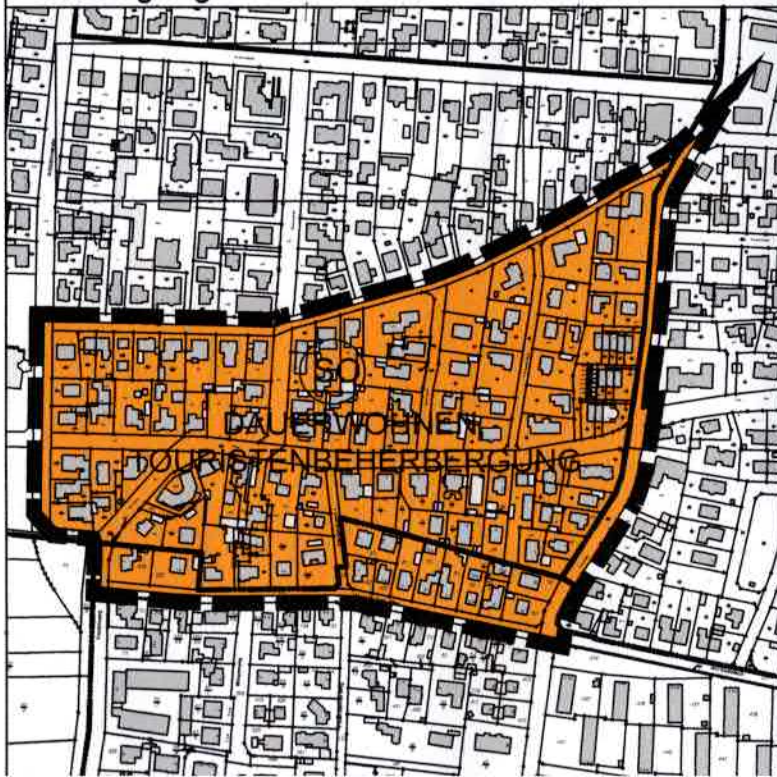
Anpassung des Flächennutzungsplanes durch Berichtigung