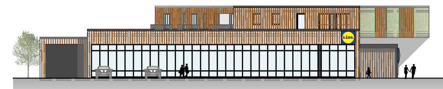
Ansicht Osten M 1:500