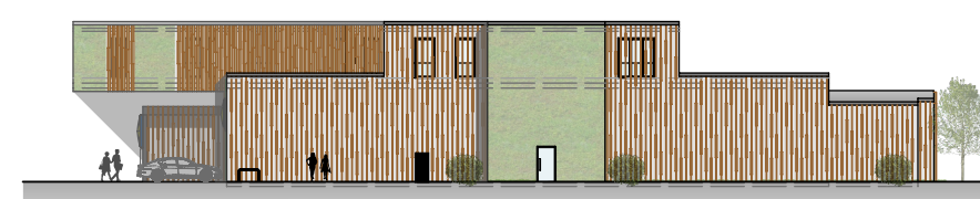
Ansicht Westen M 1:500