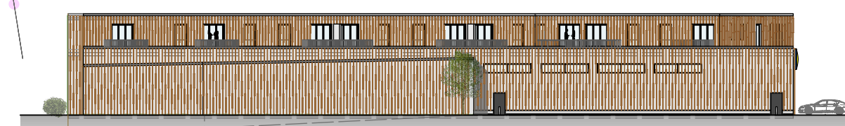
Ansicht Süden M 1:500

MASSE SIND AM BAU ZU PRÜFEN! STATIKPLÄNE BEACHTEN!